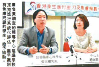
■負責調查的循道衛理楊震社會服務處中心建議學校定期進行系統化評估，給予協助。

核心提示：壓力人人都有，年紀小小的小學生也不例外。一項調查發現，香港小學生的「焦慮指數」遠高於內地和西方國家，當中又以小四學生的焦慮情況最嚴重，又發現家庭的經濟和父母的婚姻狀況，都會影響小孩子的情緒，情況嚴重更可能破壞他們的身心發展，從而臨床心理學家張正剛希望，本港小學可以定期進行系統化評估，以提早識別有焦慮問題的兒童並提供輔導。