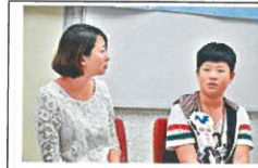
■小六學生子康稱，功課多壓力大，每日要用兩至三小時做功課。